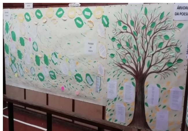
POEMAS AO VENTO – ÁRVORE DA POESIA Biblioteca - Bloco A

As alegrias e as dores Mudam com as estações Crescem como as flores Nos nossos corações. Precisam de respirar não as podemos fechar Há que cuidar e regar E, depois, saber esperar!