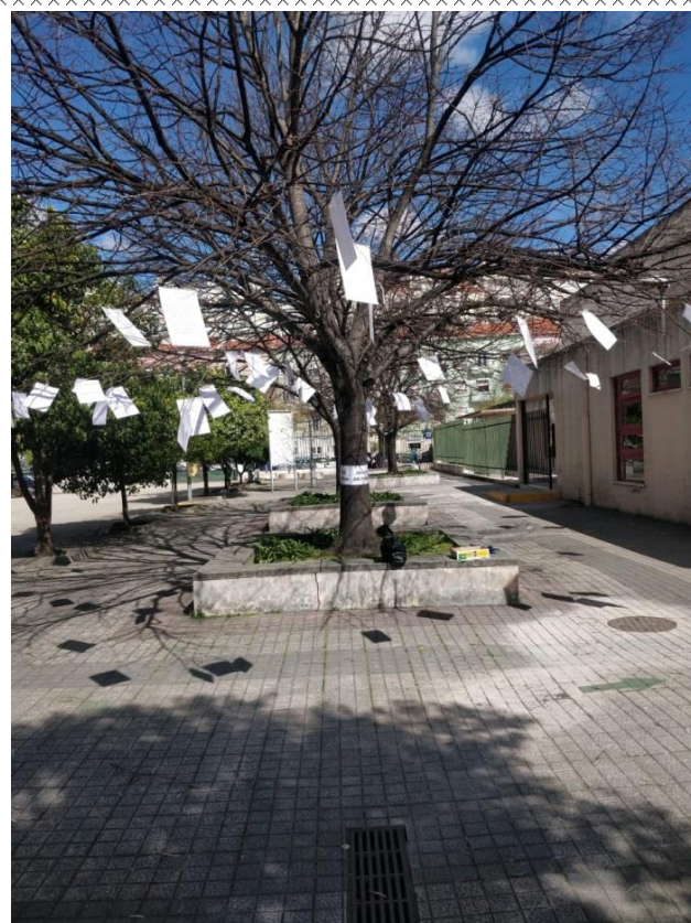
Biblioteca - POEMAS AO VENTO- Exterior