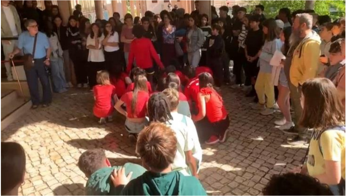
Os alunos do 7.ºs, 8.º, e 9.º anos realizaram a leitura dramatizada do poema "Urgentemente", de Eugénio de Andrade.