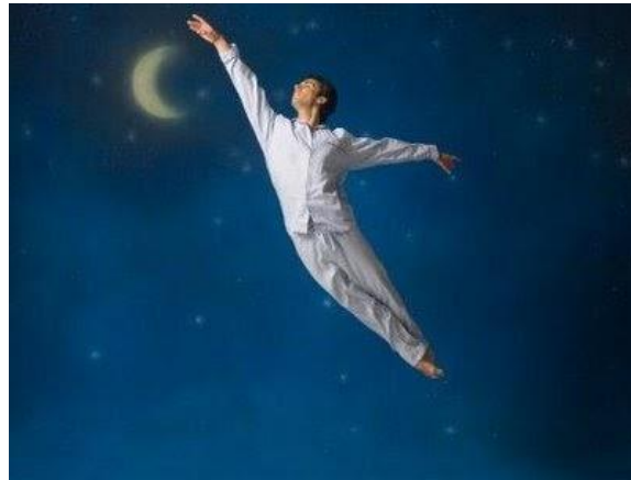
Imagem retirada do google