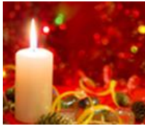
Imagens retiradas do google