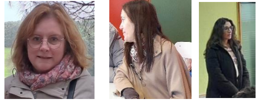
Aula de Cidadania e Desenvolvimento – 5.º A

Moral da história: quando te disserem que não és capaz, não dês ouvidos, segue o teu sonho!