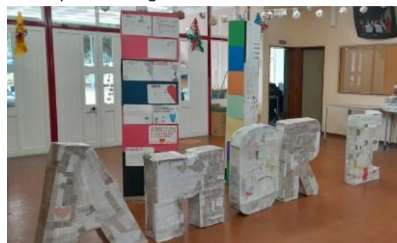
Trabalhos de CEA e AL- 8.º ano - prof. Paula Ferro