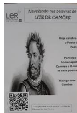
Grupo de Português 3.º ciclo e Biblioteca da E.B.Q.M