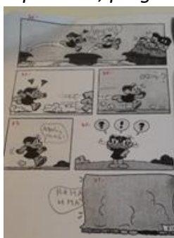
Ruben, 5.º ano